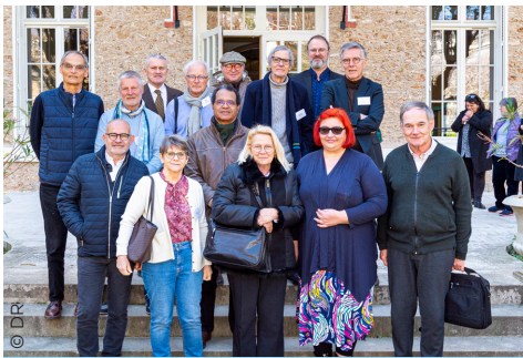
Délégués région Nord, Est et Rhône