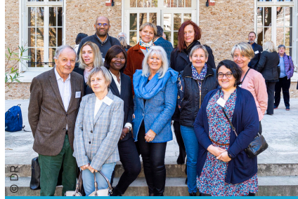
Délégués région Seine-Ouest