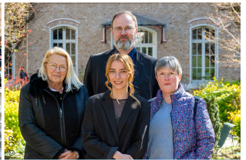
Nord (Dunkerque), Est et Rhône