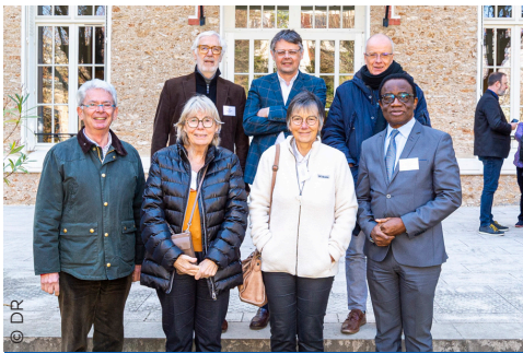
Délégués région Grand-Sud